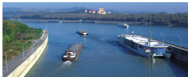
Vessels at Lock Melk

Inca de la inceput, din faza de pregatire a proiectului, abordarea inovatoare a fost una dintre caracteristicile WANDA.