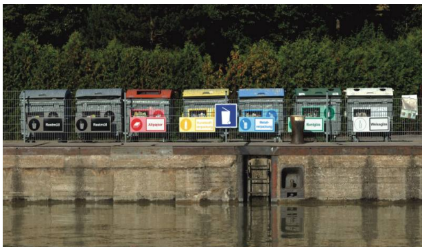
Waste Collection Point at Lock Persenbeug